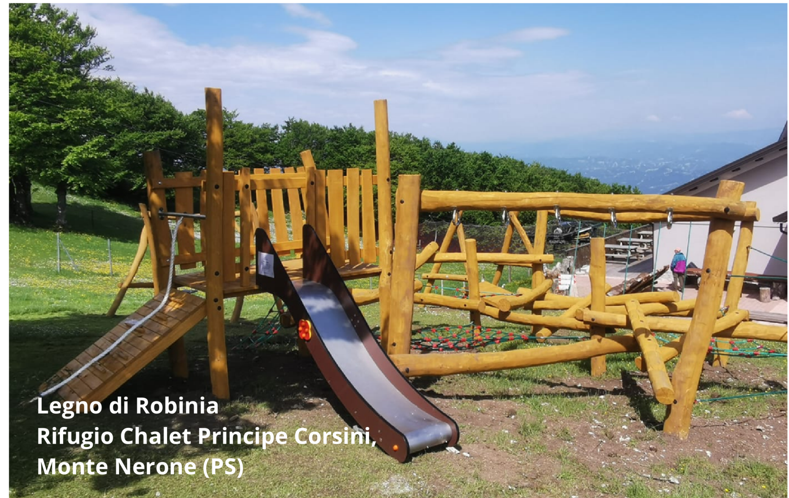
Legno di Robinia Rifugio Chalet Principe Corsini, Monte Nerone (PS)