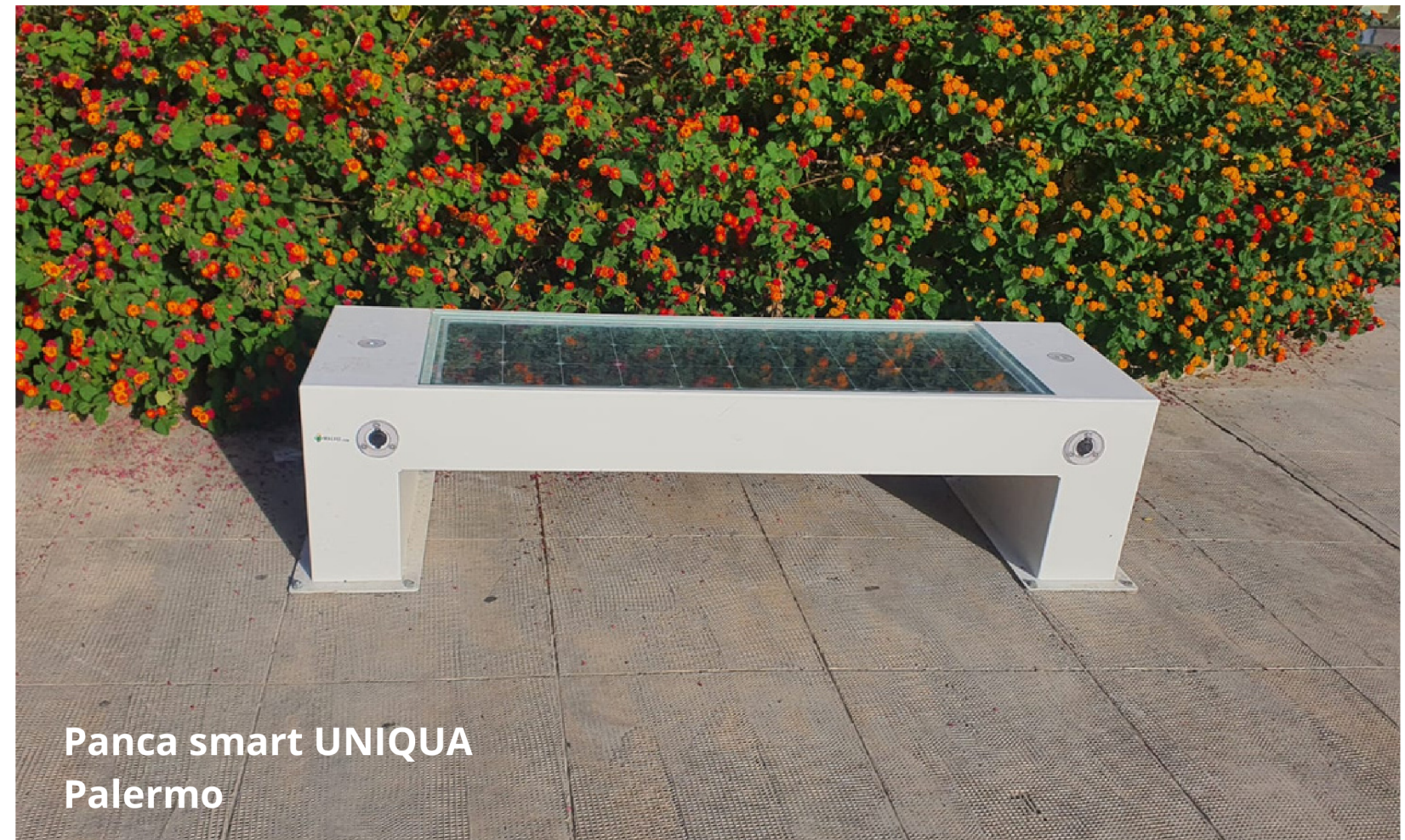
Panca smart UNIQUA Palermo