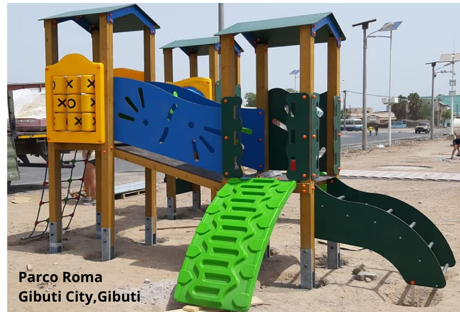
Parco Roma Gibuti City, Gibuti