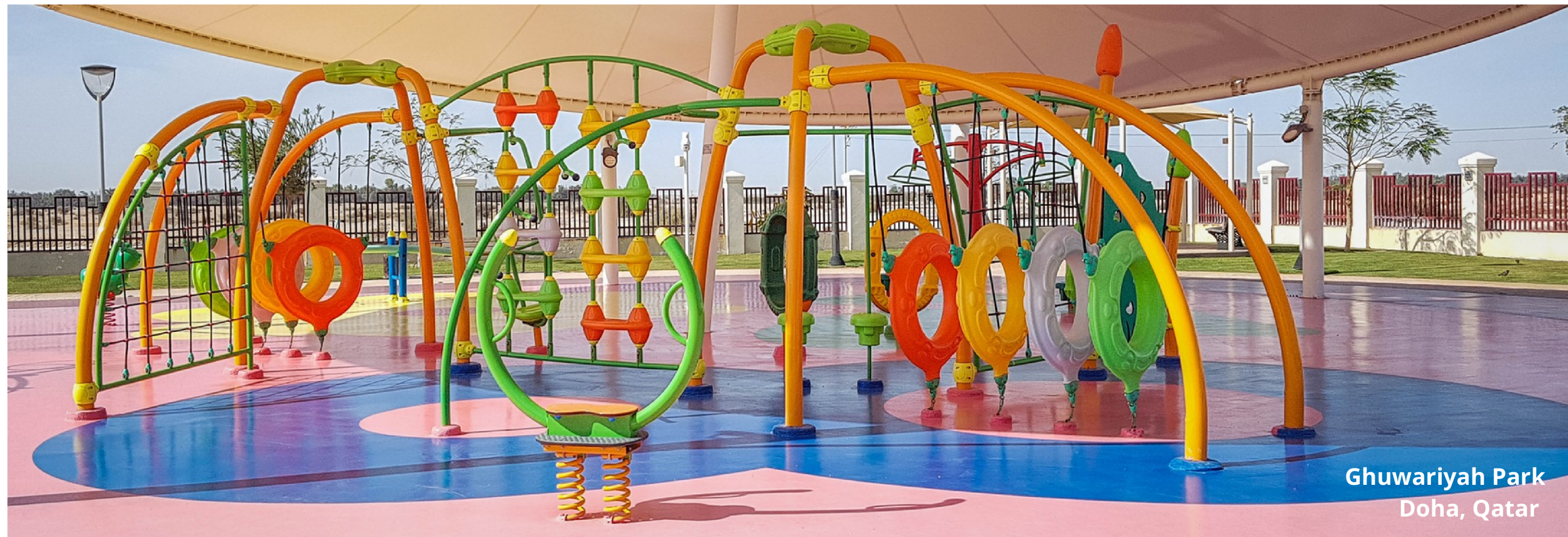
Ghuwariyah Park Doha, Qatar