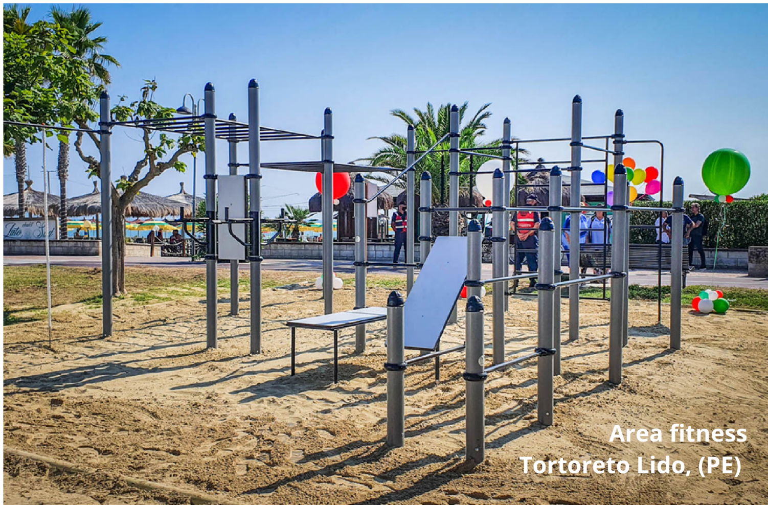
Area fitness Tortoreto Lido, (PE)