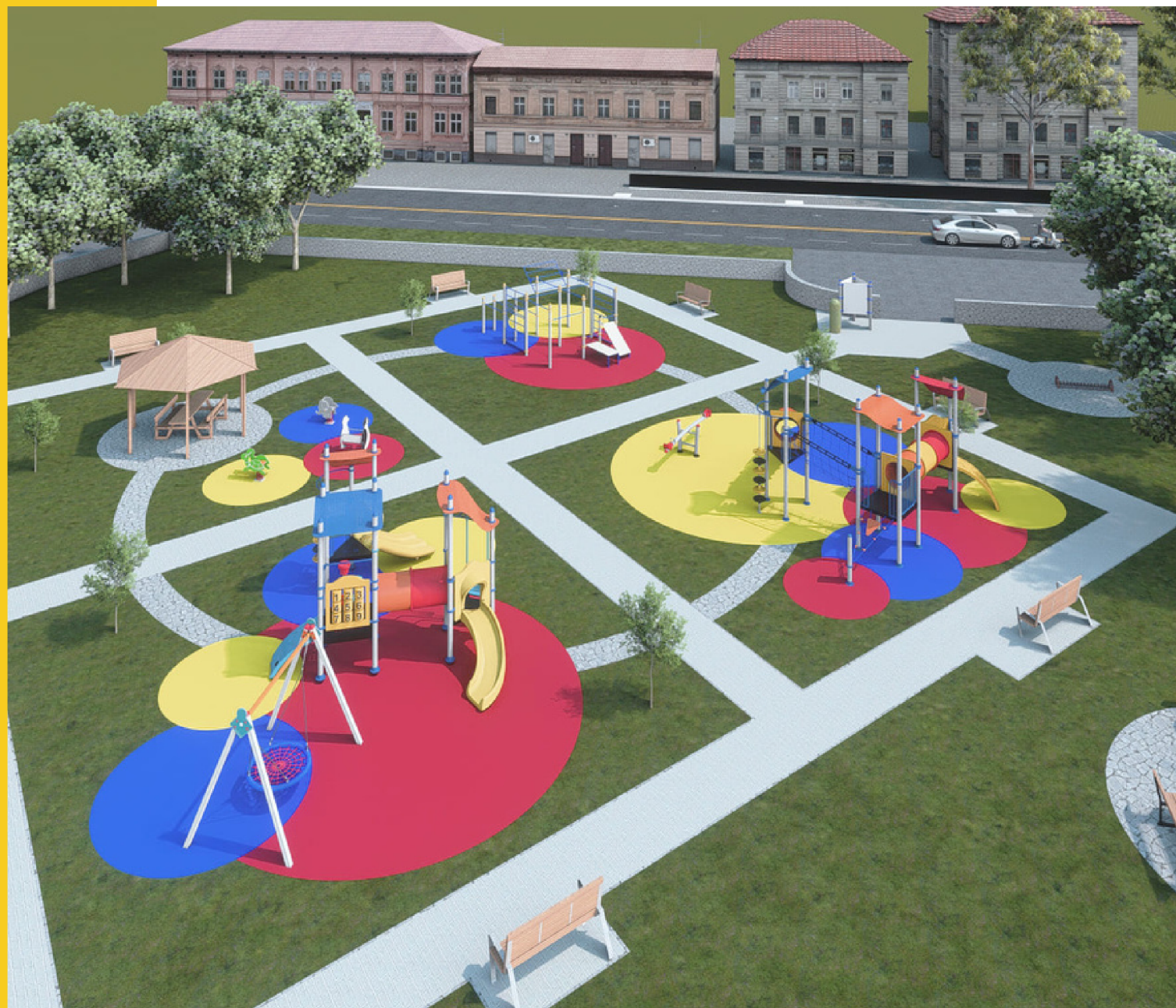
Ns. realizzazione Comune di Almé (BG)