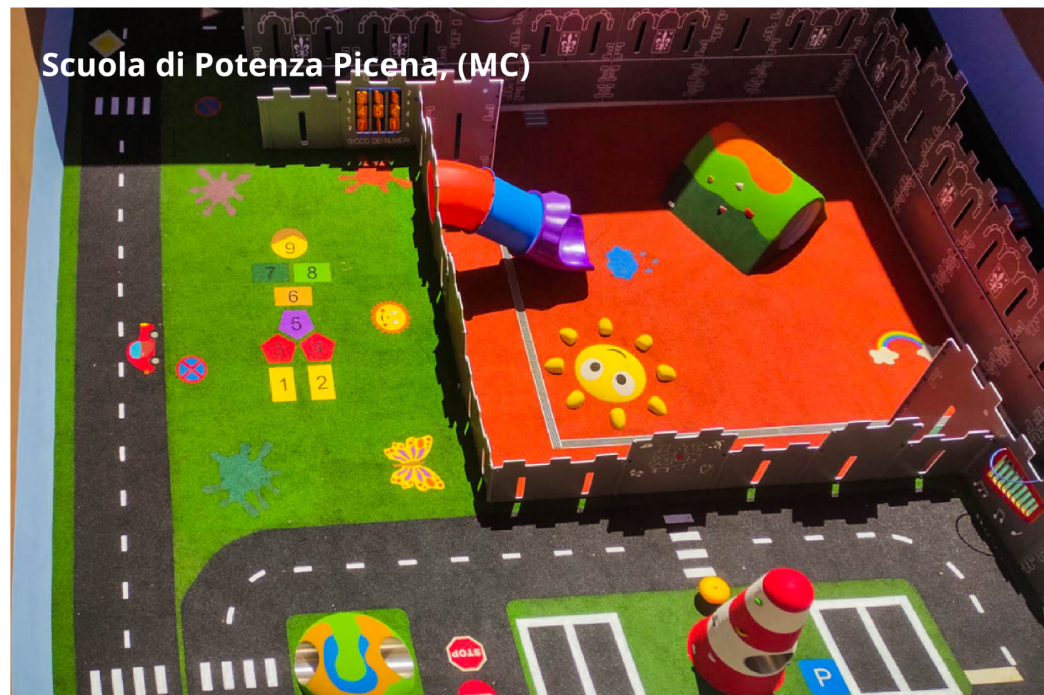
Scuola di Potenza Picena, (MC)