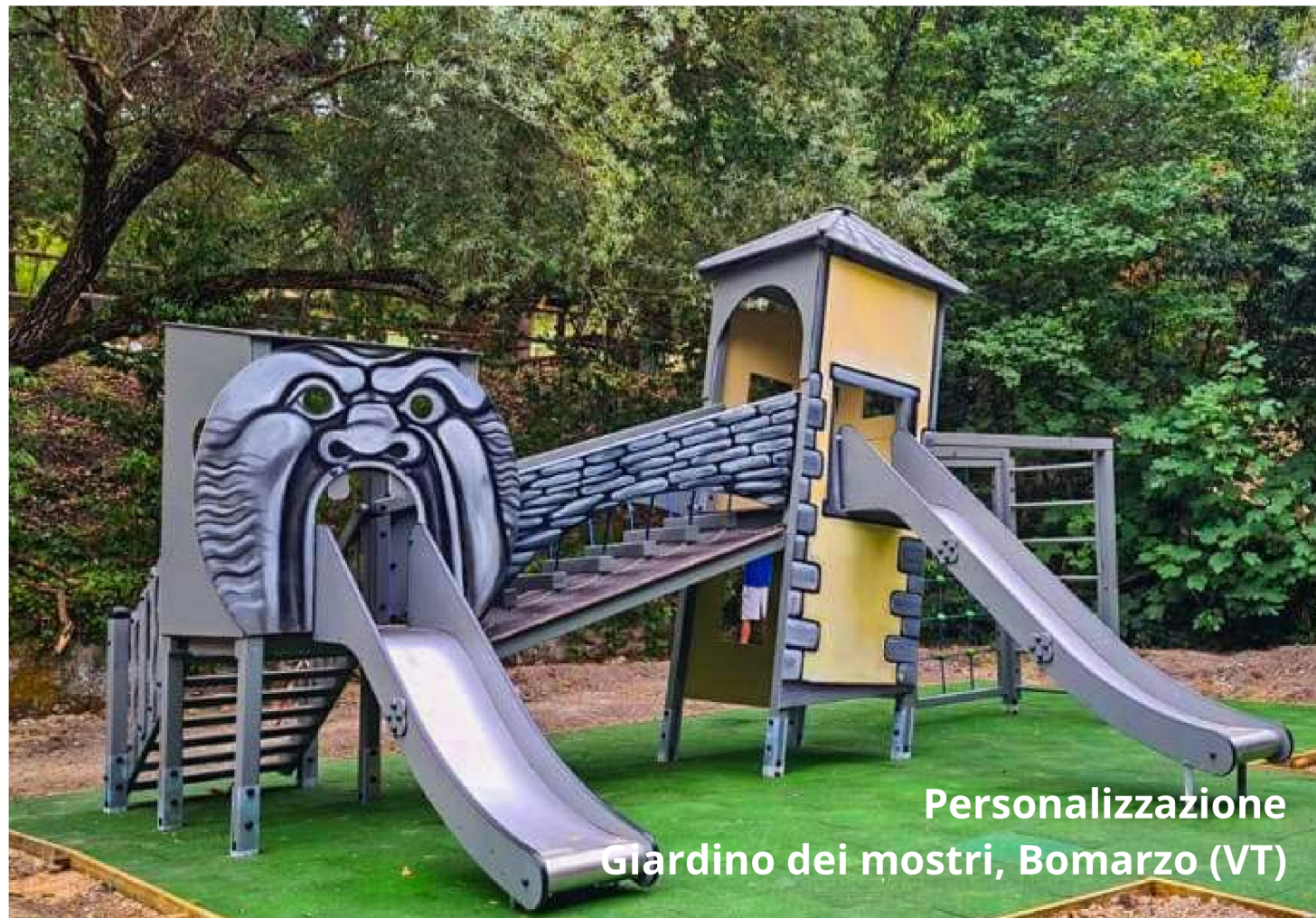
Personalizzazione Giardino dei mostri, Bomarzo (VT)