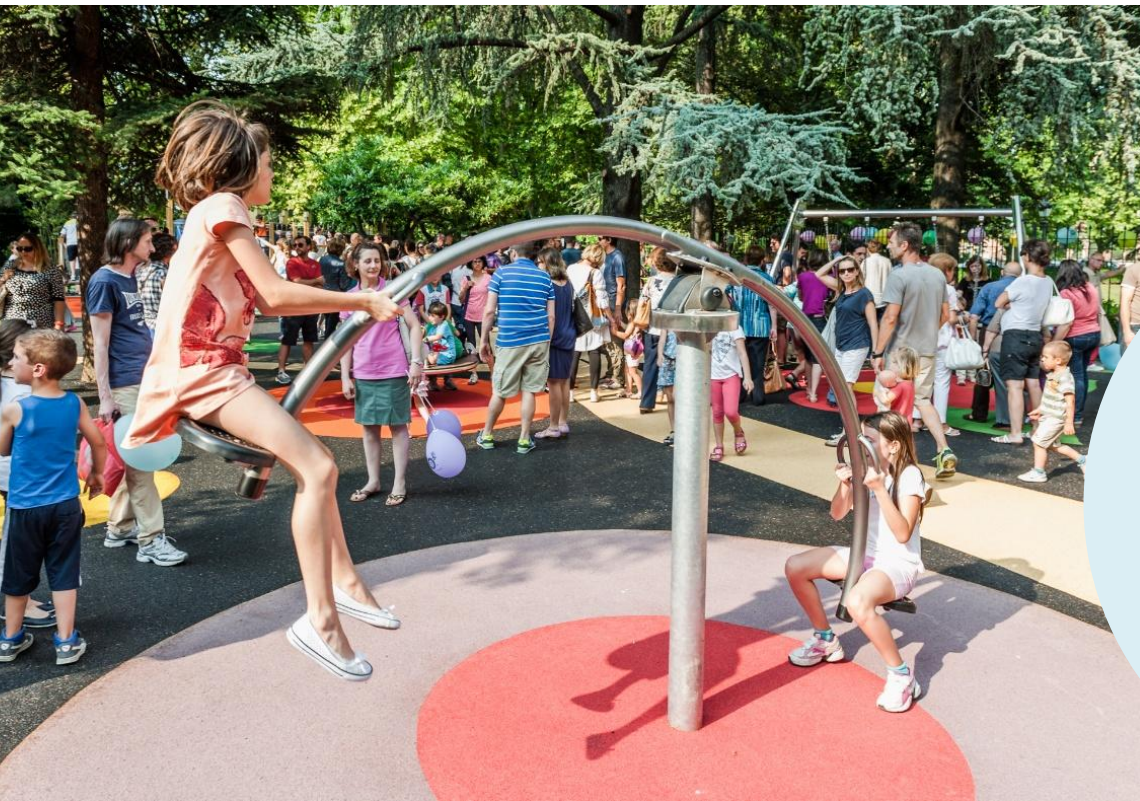
Caso Tortona → da area marginale a luogo di incontro